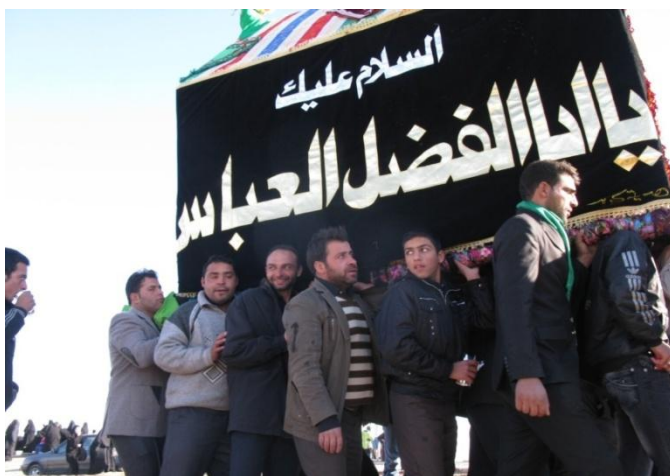
عکس شماره ۷- مراسم نخل گردانی در ششتمد. عاشورای ۱۳۹۰

هنگامی که دسته‌ی عزاداری از جلو حسینیه‌ی ابوالفضل‌ی ششتمد راه می‌افتد و به آرامگاه بیهق می‌رسند، نخل گردانان با صلوات بر محمد و آل محمد و لعنت بر شمر و یزید نخل را از زمین بلند و به روی شانه‌هایشان می‌گذارند و به راه می‌افتند. در ششتمد همه مردان بالغ می‌توانند در مراسم نخل گردانی شرکت کنند و فرد یا افراد خاصی مسئول این کار نیستند.