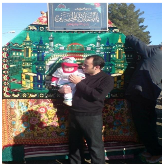
عکس شماره ۶- پدری نوازدهش را به کنار نخل آورده است. عاشورای ۱۳۹۰