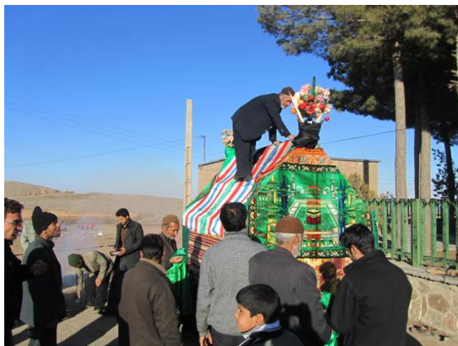
عکس شماره ۴- مراسم نخل آرایی در ششتمد عاشورای ۱۳۸۸، عکاس مهدی عسگری

(آماده کردن نخ و سوزن)، عکاس مهدی عسگری عاشورای ۱۳۸۷