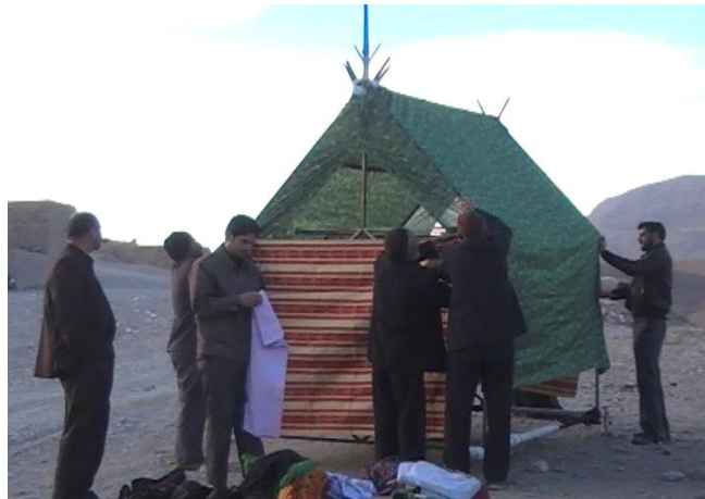
عکس شماره ۲- مردان در حال نخل آرایبی، ، عاشورای ۱۳۸۷