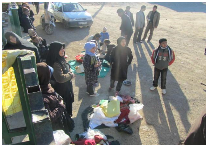
عکس شماره ۵- کودکان و زنان نظاره‌گر مراسم نخل آرای عاشورای ۱۳۸۸

در مورد کودکان هیچ کودک دختر یا پسری در کمک به انجام این مراسم شرکت ندارد، فقط گاهی کودکانی برای مشاهده این مراسم می‌آیند.