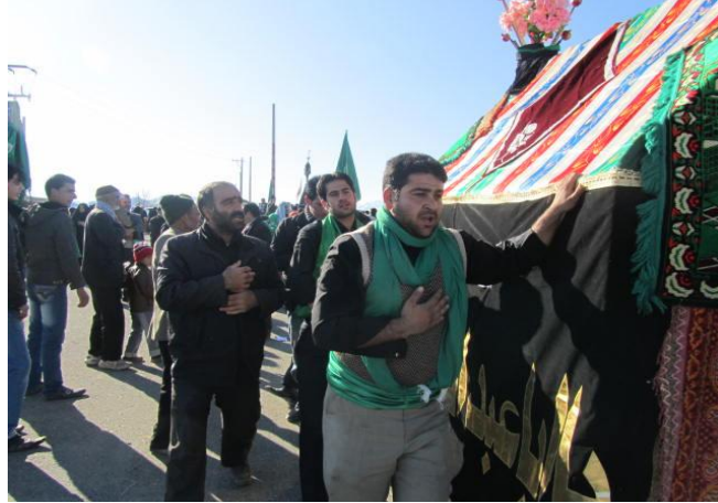
عکس شماره ۹- سینه زدن دور نخل، عکاس مهدی عسگری، عاشورای ۱۳۹۰

آیین نخل گردانی در متن مراسم روز عاشورا برگزار می‌شود و تا ظهر عاشورا ادامه دارد حدود ظهر موقع اذان که نخل گردانان، نخل را به جلو مسجد جامع آورده و روی زمین گذاشته‌اند و هیئت عزاداران مشغول سینه‌زنی و زنجیرزنی است. با بلند شدن صدای اذان عده‌ای به مسجد جامع برای گذاردن نماز و عده‌ای به حسینیه و مسجد امام حسین برای صرف ناهار می‌روند و تعدادی از مردان جوان نخل را به روی تپه‌ی بیهق که صبح همان روز در آن مکان آراسته شده بود بر می‌گردانند تا یکی یکی پارچه‌ها واچیده شود. ولی از جمعیت صبح خبری نیست و آقای خالقی به تنهایی این کار را انجام می‌دهند.