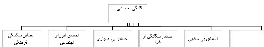
نمودار (۱) شاخص بیگانگی اجتماعی ملوین سیمن

می‌شود. در شرایطی که بین اهداف اجتماعی و در وسائل و راه‌های رسیدن به آن اهداف، تطابقی وجود نداشته باشد، در این صورت هم مسیر برای بروز بی‌هنجاری، مناسب به نظر می‌رسد. انزوای اجتماعی احساسی است که فرد از محدوده‌ی مقبولیت اجتماعی طرد و به کنار زده می‌شود و به عبارتی، فرد از متن اجتماع و لرش‌های حاکم در آن منفک می‌شود. بیگانگی فرهنگی، احساسی است که طی آن فرد نسبت به باورها و اهدافی که در یک جامعه‌ی خاص، ارزشمند و دارای پاداش اجتماعی می‌باشد، اعتقاد نازلی به آن دارد.